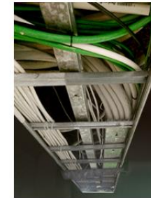
Kabelstega med elledningar till vänster och teleledningar till höger.

Finns ledigt utrymme på befintlig kabelförläggning, så används den och kabeln installeras på ett kvalitetssäkrat sätt.